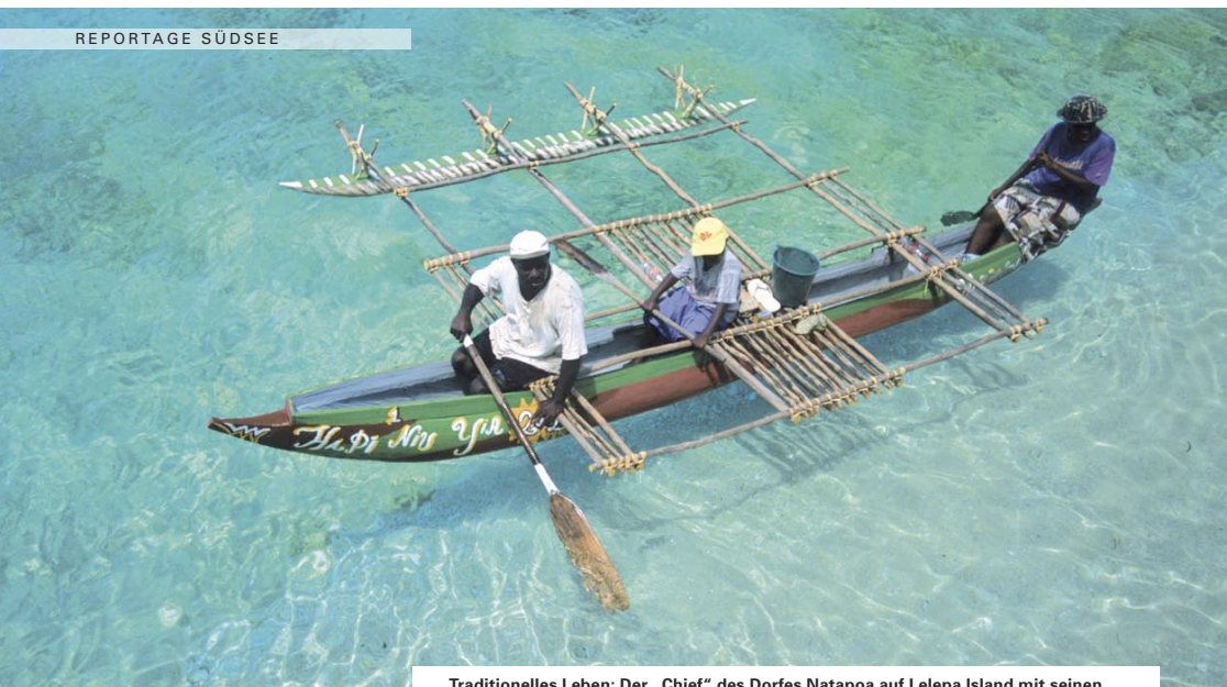
Traditionelles Leben: Der „Chief“ des Dorfes Natapoa auf Lelepa Island mit seinen beiden Töchtern im Auslegerboot.

Das Wasser ist von einer Klarheit, die trunken macht. Bunte Korallengärten ziehen unter mir vorbei, farbenprächtige Fische flitzen in Deckung. Plötzlich verfärbt sich das Wasser, wird dunkelblau. Ich schwebe mit meinem Kajak über einem der vielen tiefen Unterwassercanyons vor der wilden Nordseite von Moso Island nahe der Purumea-Passage.